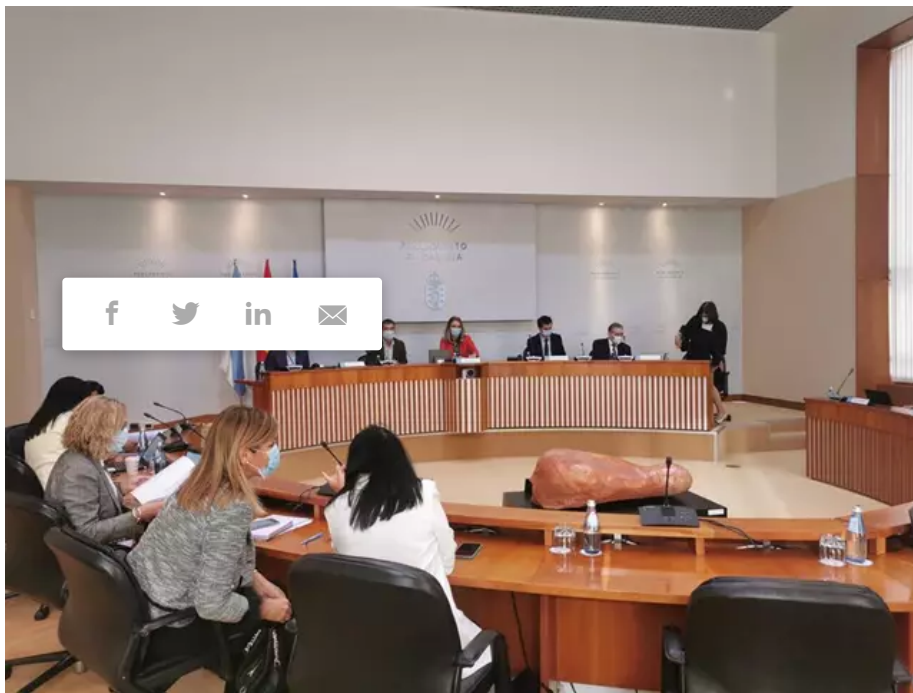
Comisión de Relaciones co Consello de Contas del Parlamento de Galicia, a 29 de septiembre de 2020.

La Cámara también demanda a este órgano el control financiero de Sogama, Povisa, la Fundación Centro Tecnolóxico da Carne y el gasto farmacéutico