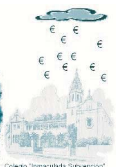
Viñeta publicada no "STEG Informa" de Xaneiro do 2004. Moi ao noso pesar, segue a estar vivente.