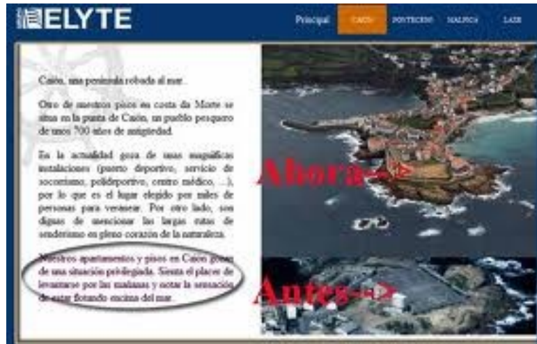
Foto 6.- Captura de la página web del grupo ELYTE promocionando la promoción y venta de viviendas de lujo.