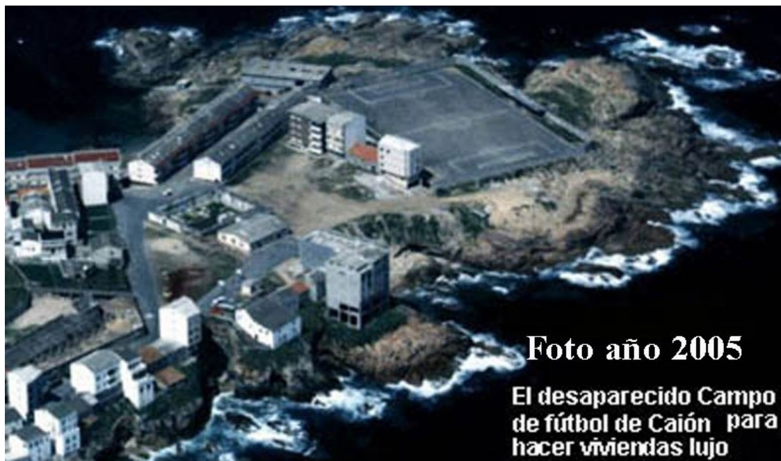
Foto 7.- Captura del solar ARC1 realizada el 28 de Marzo de 2019.