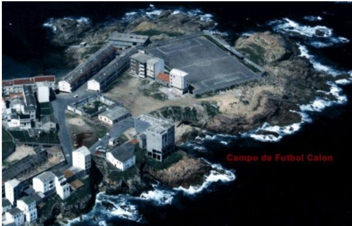
Foto 2.- Destrucción y derrumbe, movimiento de tierras, desescombro de las instalaciones y promoción del proyecto:

Foto.-1 Estado primigénido anterior a los proyectos urbanísticos construido sobre el año 1980 por la Federación Gallega de Fútbol bajo concesión a 50 años.