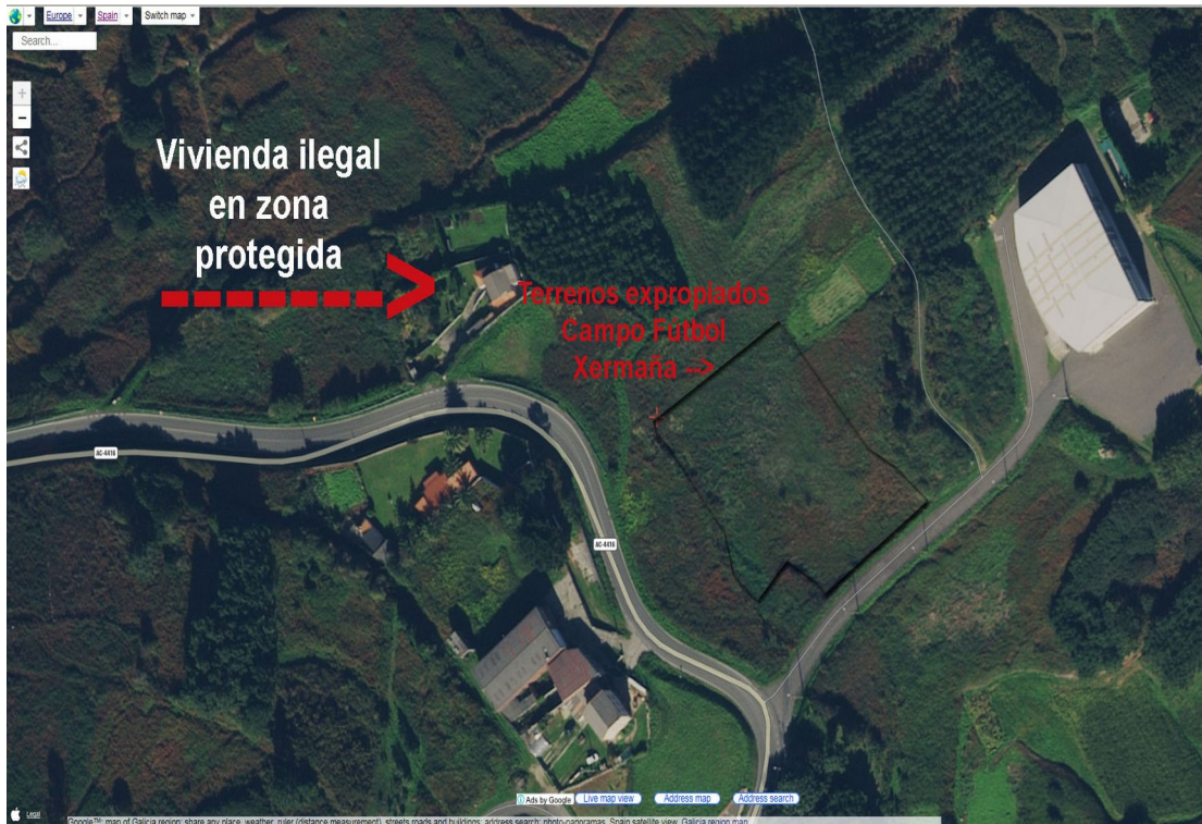
Foto 11.- Captura de los dos terrenos recalificados