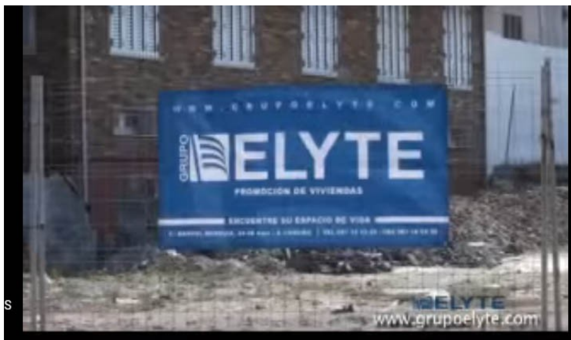
Foto 5.- Captura de la página web del grupo ELYTE promocionando la promoción y venta de viviendas de lujo