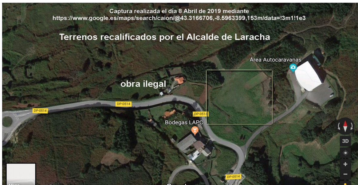
Foto 9.- Captura de los dos terrenos recalificados