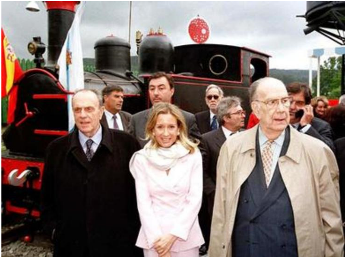
Camilo José Cela e Manuel Fraga na inauguración da fundación

O Goberno Galego sinala que “ante a posibilidade de que a venda dos fondos da Fundación puidese derivar cara a mans privadas, a Comunidade Autónoma estableceu o procedemento de adquisición de fondos de interese para centros artísticos e museísticos de xestión autonómica”.