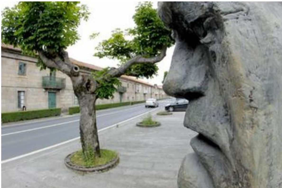
Sede da Fundación Camilo José Cela en Iria Flavia